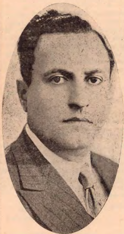
Dr. don Rafael A. Calderón Guardia

Entre los centenares de cablegramas, radiogramas, telegramas y mensajes de toda índole llegados al señor Presidente de la República —unos con motivo de la fecha de la Independencia, otros con ocasión de su discurso—, hemos entresacado los precedentes de los Jefes de Estado de América, que dicen así: